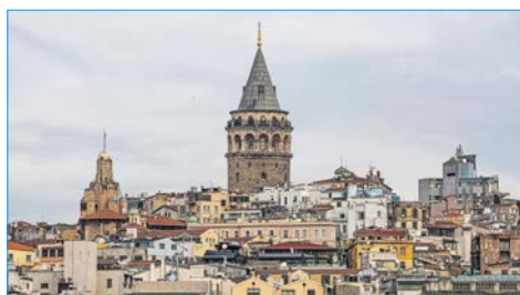
Istanbul, la tour de Galata.

Quel intérêt de vous parler de tout cela, alors que le sujet qui nous intéresse est l'homéopathie ? Eh bien c'est justement le sujet ! L'homéopathie n'est pas reconnue en Turquie (par le gouvernement) et la vente des remèdes homéopathiques est pour l'instant encore en attente d'autorisation.