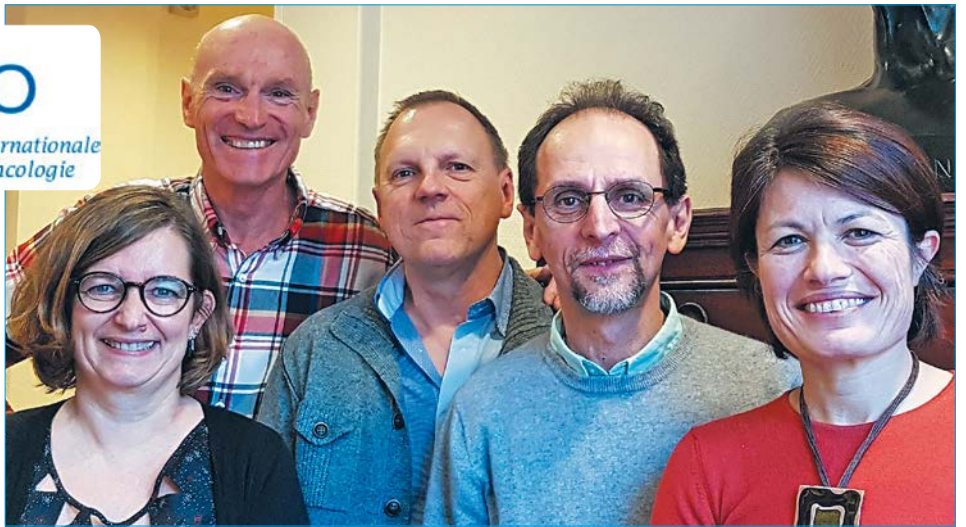
Le bureau de la SHISSO 2018.

On observe actuellement un double mouvement, avec d'un côté, des médecins et des pharmaciens homéopathes qui se sont formés en oncologie et de l'autre côté, des spécialistes en cancérologie qui ont intégré la prescription homéopathique dans leur pratique.