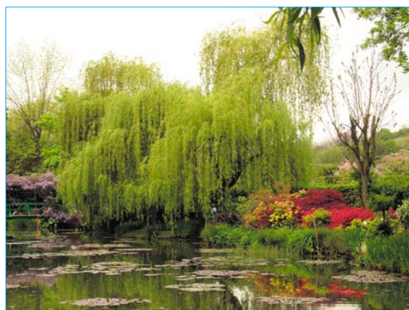
Le jardin de Claude Monet à Giverny.